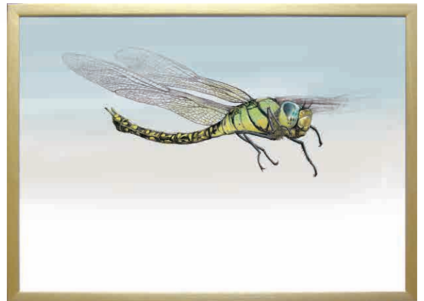
賢・Oniyanma×? ▶ 728×515